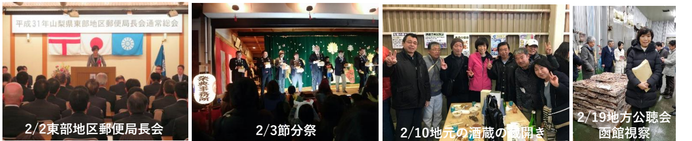
2/2 東部地区郵便局長会