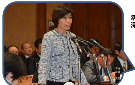
2/5 衆議院予算委員会で質問