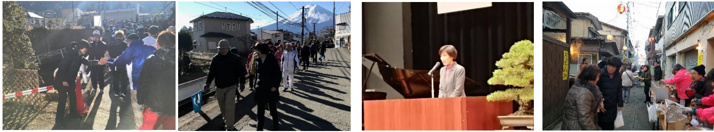
1月 元旦ウォーキング・成人式・どんど焼き・出初式など各地の恒例行事に参加させていただきました。