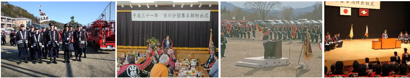
平成三十一年 日川分団第五部出初式