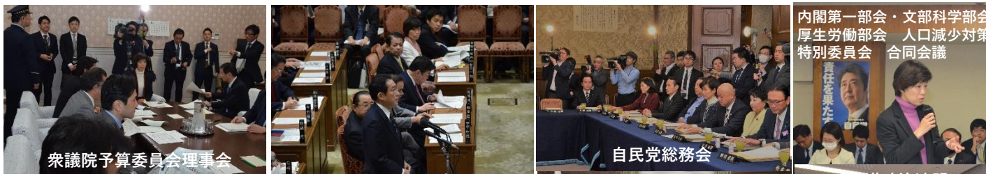
衆議院予算委員会理事会