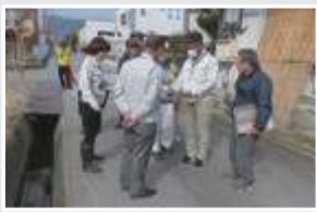
通学路の安全確保