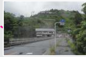
月夜野トンネル事業化決定