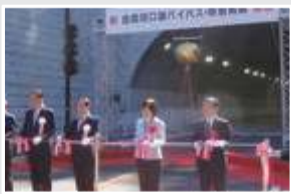
新倉河口湖トンネル開通式