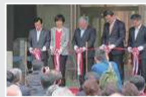
小菅村公民館リニューアル