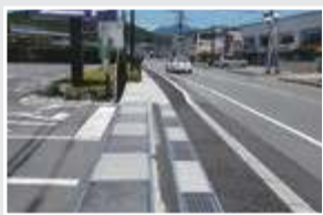
市道塩山上於曾81号線歩道改修