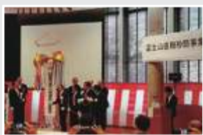
富士山の直轄砂防事業