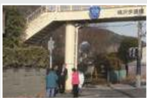
歩道整備事業の促進