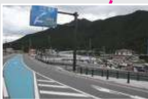
富士吉田西桂IC開通