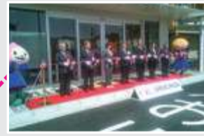
JR上野原駅南口開発