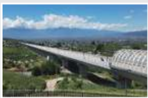
2027年に開業を控えたリニア