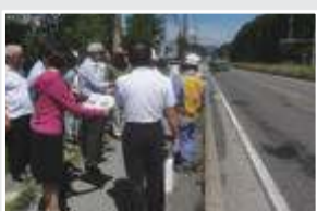
国道139号勝山バイパス整備