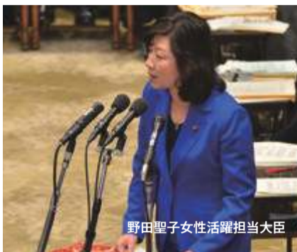
野田聖子女性活躍担当大臣

女性活躍社会の実現は、日本の成長戦略の一丁目一番地。社会の多様性と活力を高め、わが国経済を力強く発展していく上でも極めて重要。引き続き女性活躍が生産性向上や経済成長に結びつくという観点を共有しつつ、積極的に取り組む。