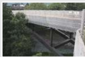
県道大幡初狩線改良