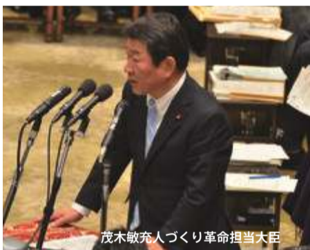
茂木敏充人づくり革命担当大臣

家族のライフステージの変化に応じ、仕事を辞めたり、再開したりしたい女性も多い。そういった女性たちに学び直し、つまりリカレント教育は大切だが、政府の見解を伺いたい。