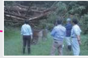
台風被害後の迅速な復旧支援