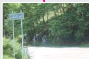
東京五輪自転車競技コース